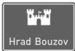
Informační návěst IS 23

Jistě jste si všimli, že se u významných silničních tahů již několik let objevují informační hnědobílé dopravní značky. Tyto značky odkazují na atraktivní turistické cíle. Dle mého názoru má toto značení dvě funkce. Za prvé informovat a zaujmout řidiče o blízkosti atraktivního místa. Za druhé řidiče mířící již do tohoto místa správně a hlavně bez stresu dobře navést.