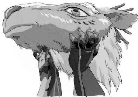
Ashitaka pozvedá utatou hlavu Ducha lesa http://www.animecellar.com