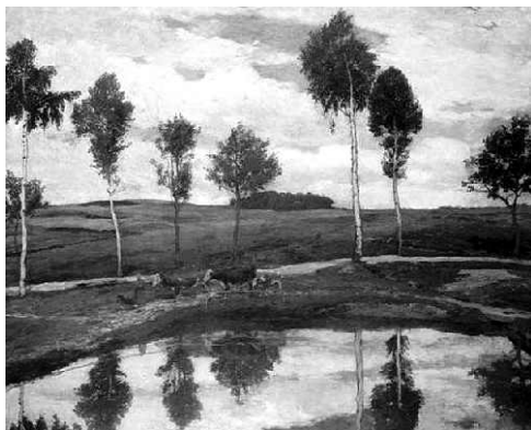
Antonín Slavíček, U nás v Kameničkách, 1904

ŠŤÁVA: Březová šťáva se uchovává v dřevěných bečkách lehce posypaná ječmenem. Když zrna vyklíčí, vytvoří se zelený povrch a šťáva získá zvláštní jemnou chuť, kterou lze „přikroenit“ mátou a jinými přísadami. Samotná šťáva je nasládlé chuti s vůní přírody.