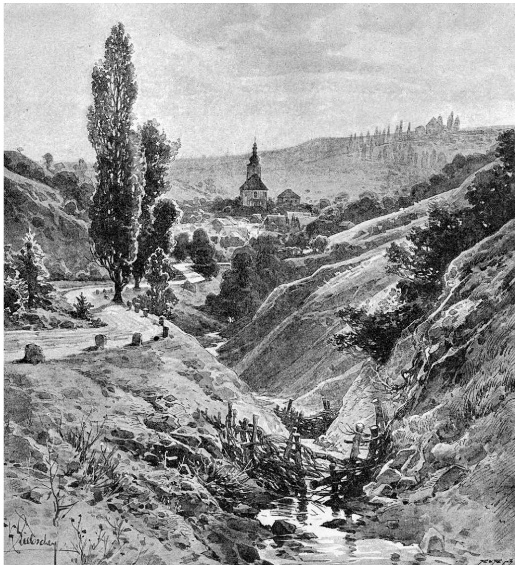
Úteré, kol. 1900

Dnes je město osídleno z velké části volyňskými Čechy a částečně i Slováky. Je samozřejmé, že jsou tu i Češi. Obyvatelé svorně spolupracují a vykonali tu hezký kus práce. O tuto práci se zasloužila především obecná škola se svými učiteli.