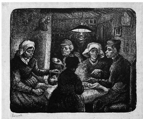
Vincent Van Gogh – Jedlíci brambor, litografie, 1885

Otrháme mladé smrkové výhonky (cca 35 dkg). Výhonky se sbírají asi do 15. května. Spaříme je v 1 litru převařené vody a necháme 2 dny louhovat. Pak výluh pře-